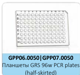
GPP06.0050 | GPP07.0050

Планшеты GRS 96w PCR plates (non-skirted)