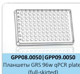
GPP08.0050 | GPP09.0050

Планшеты GRS 96w PCR plates (half-skirted)