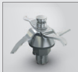
Стандартный нож с 4 лезвиями