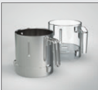
Контейнеры для проб объемом 1,4 литра