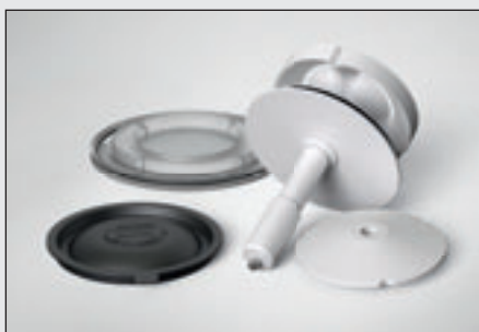
Крышки контейнеров для проб