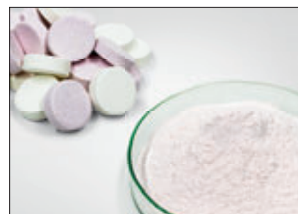
Печенье и таблетки до и после измельчения на ножевой мельнице PULVERISETTE 11