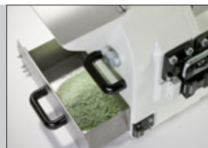
Результаты измельчения при ширине зазора 1 мм