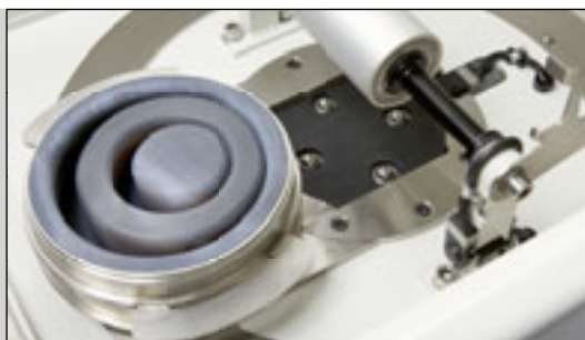
Прижимающие детали для автоматического подъема размольной гарнитуры и предохранительный выключатель, проверяющий глухую посадку.