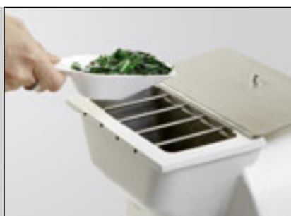
Наполнение воронки предварительно размельченными стеклянными бутылками