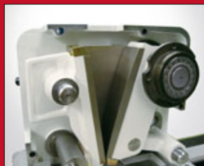
Вид камеры дробления при снятом корпусе.

Особенно безопасно и без образования пыли: закрытая камера дробления с защитой от случайного проникновения обеспечивает безопасную, без образования пыли работу всех движущихся частей. Благодаря имеющемуся месту подсоединения, очень просто использовать вытяжное устройство для автоматического удаления мелкой пыли, появляющейся при дроблении. Это вытяжное устройство также очень удобно использовать для очистки дробящих частей.